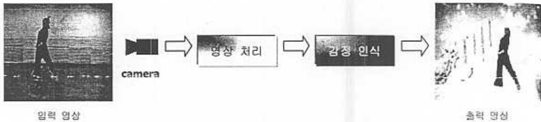
그림 1. 실시간 감정인식 시스템 개요.