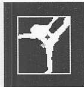
그림 2. 신체 움직임의 단순화.

신체 각 부위에 대한 복잡한 3차원 정보를 실시간에 안정되게 추출하는 것은 현재의 기술 수준으로는 매우 어렵기 때문에, 본 논문에서는 일반 PC에서도 실시간 처리가 가능한 시스템 구축에 중점을 두고, 2차원 영상에서 보여지는 3차원 동작을 사각박스나 무게 중심 등의 움직임으로 단순화 시켰다. 그림 2에서 보는 것처럼, 사각 박스의 크기나 무게 중심의 위치 좌표 등의 특성량을 이용해서 신체 움직임을 나타내고 있다.