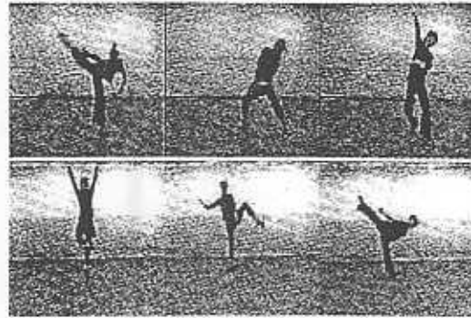
그림 3. 실험에 사용된 영상.

본 논문에서는 10 샘플씩 평균을 취하여 각 특성량 별로 초당 3개의 평균값을 인식에 사용하였다.